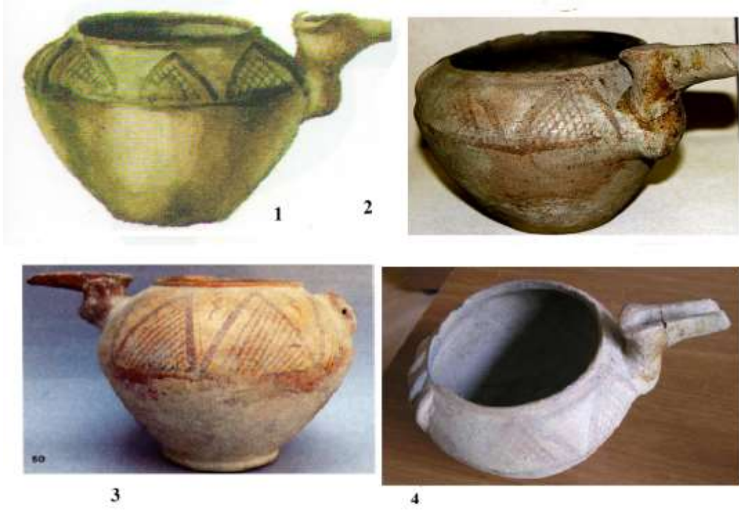
(1, 3-Kızılburun nekropolü (İbrahimli, İsmayılzade, 2013, Nahçıvan Devlet Tarih Muzesi, İnv. 354vb), 2-II Kültepe (Azerbaycan Devlet Tarih Muzesi Inv.Ak.245 4-Plovdağ nekropolü (Azerbaycan Devlet Tarih Muzesi Inv.Av.534)